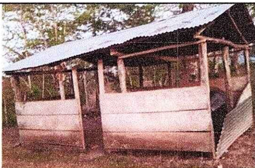
Levantamiento de cocina de 4 hiladas de block y malla.