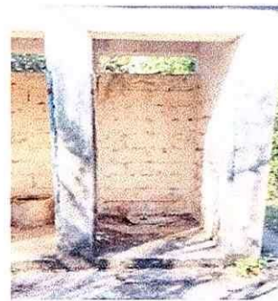
Cambio de letrinas