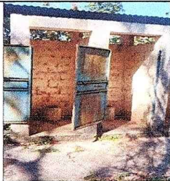
Repello y cambio de puertas.