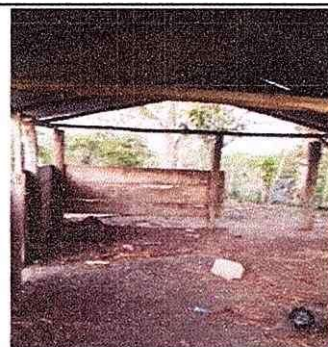
Area de polleton y manipulacion de alimentos

Observación: Si es necesario se pueden agregar hojas adicionales y actualizar el número de hojas.