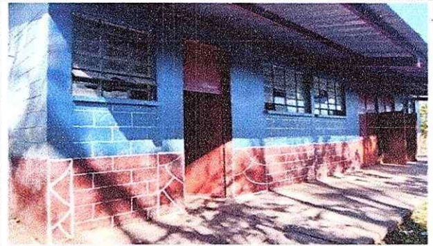
Cambio de vidrios, reparacion de puertas y pintura.